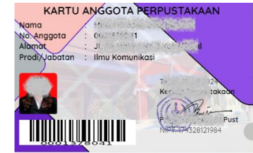
CONTOH KARTU PERPUSTAKAAN

Upload foto kartu perpustakaan jika punya ( Ada ) Kosongkan jika tidak punya